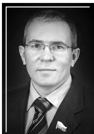
ФЕДОРОВ Алексей Геннадьевич председатель комитета по труду и социальной политике