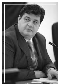
НОВОЖИЛОВ Кирилл Львович председатель бюджетно-налогового комитета