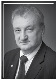
ВИЦКЕ Альберт Эрихович (срок полномочий с декабря 2007 по май 2009)