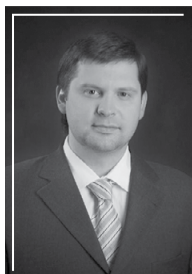
КАРАСЕВ Антон Владимирович председатель комитета по промышленности и инновационной политике