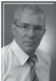
ФЕДОРОВ Алексей Геннадьевич (срок полномочий с октября 2010 по декабрь 2011)